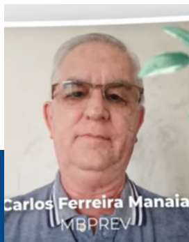
SAÚDE E QUALIDADE DE VIDA